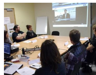
Collectif sur l'utilisation des réseaux sociaux

Nous nous appuyons sur les missions d'intérim et les mises en situation professionnelle pour accompagner les salariés vers l'emploi durable en leur donnant accès aux différentes techniques de recherche d'emploi afin qu'ils maîtrisent l'évolution des outils de recrutement des entreprises. En 2016, 34% des salariés ont été particulièrement soutenus dans leurs difficultés face à la recherche d'emploi.